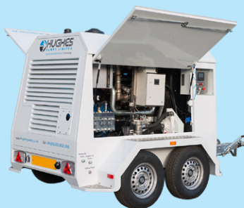
Panneaux latéraux amovibles grâce à deux vis.