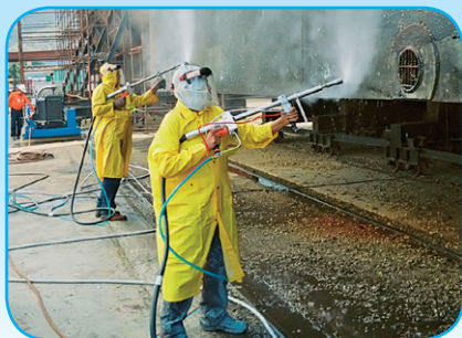
Préparation de surfaces avec deux pistolets.